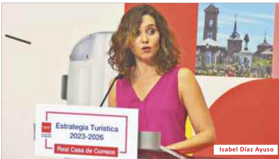
Isabel Díaz Ayuso

El Gobierno trabajará también para atraer otros grandes eventos culturales, deportivos o gastronómicos, que además de difundir el nombre de Madrid, tienen un gran impacto en la economía y en el empleo; y en reforzar la promoción turística y la comercialización dirigida tanto a profesionales del sector como al público, a través de campañas, redes sociales y ferias profesionales.