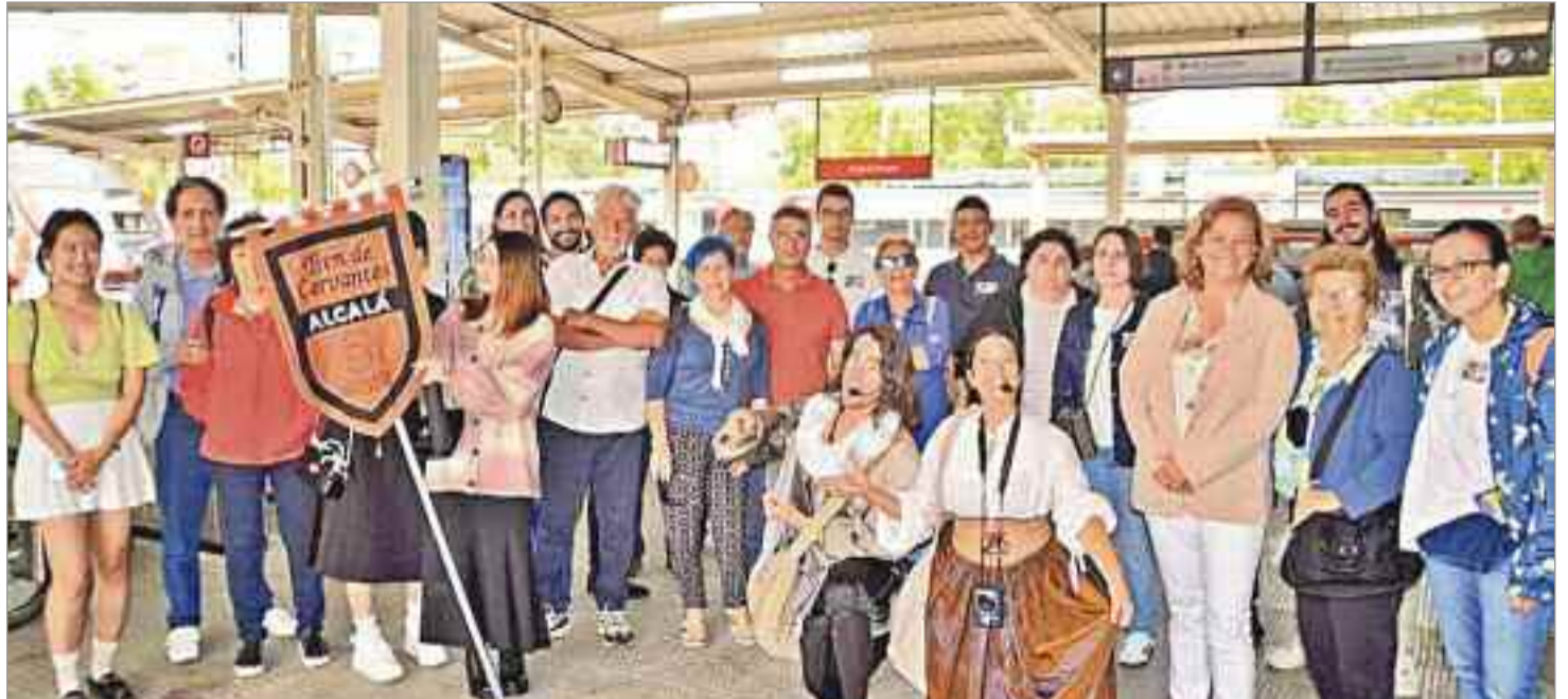
Con casi 600 viajeros, el Tren de Cervantes no solo ha superado su temporada de primavera las cifras de 2022 sino que supone una recuperación respecto a las cifras pre-pandemia.

El viaje comienza con la bienvenida de los actores en la estación de Atocha a las 10:20 horas cada sábado hasta el 2 de diciembre y parte hacia la ciudad cervantina a las 10:35. En el recorrido hasta Alcalá de