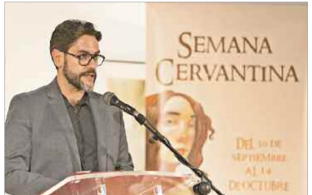
Para terminar la Semana Cervantina, el sábado 14 de octubre se celebrará en el Teatro Salón Cervantes la XXII edición del Encuentro Coral Cervantino en el participarán la alcalaína Schola Cantorum y los segovianos Coral Ágora