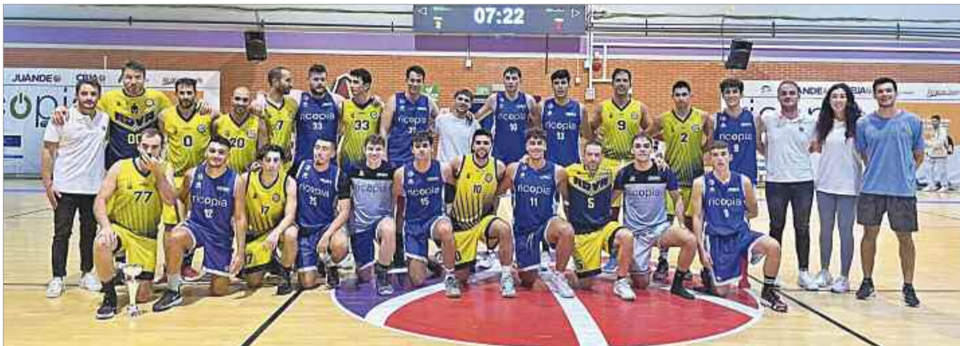
Gran ambiente en el Torneo de Baloncesto "Copa del Val 23" del Club Baloncesto Juan de Austria, en el que el CBJA se impuso en el Senior Masculino y el Spordeporte en Senior Femenino.